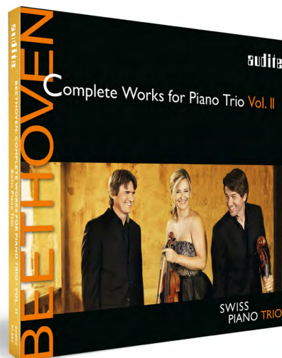
Vol. II audite.de/97693