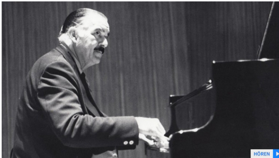
Der Pianist Jorge Bolet

"Alles ist relativ!" – Das war Credo von Jorge Bolet. Obwohl dieser Satz nichtssagend allgemein klingt, führte er ihn vor allem in großangelegten Werken zu beeindruckenden Gesamtkonzepten. Liszts Es-Dur Konzert im Live-Mitschnitt von 1971 ist ein Beispiel hierfür. Aufs Ganze betrachtet nimmt sich Bolet die Freiheit und wählt ein langsames Anfangstempo als andere Pianisten. So bleiben ihm Reserven, das Tempo wirkungsvoll zum Ende des Stückes hin zu steigern.