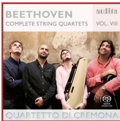
Audite SACD 9268 – 92688 8 SACD