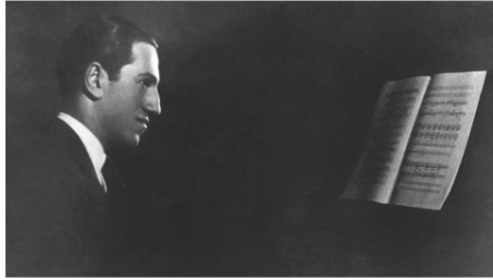
Der amerikanische Komponist und Pianist George Gershwin in einer undatierten Aufnahme.