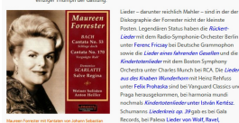
Maureen Forrester in der Opernrolle Frau Triska in 1987. Von oben: Maureen Forrester