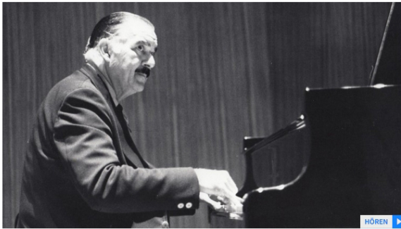
Der Pianist Jorge Bolet

"Alles ist relativ!" – Das war Credo von Jorge Bolet. Obwohl dieser Satz nichtssagend allgemein klingt, führte er ihn vor allem in großangelegten Werken zu beeindruckenden Gesamtkonzepten. Liszts Es-Dur Konzert im Live-Mitschnitt von 1971 ist ein Beispiel hierfür. Aufs Ganze betrachtet nimmt sich Bolet die Freiheit und wählt ein langsames Anfangstempo als andere Pianisten. So bleiben ihm Reserven, das Tempo wirkungsvoll zum Ende des Stückes hin zu steigern.